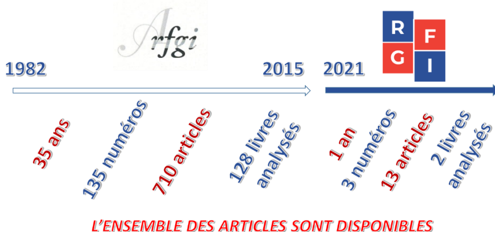
Figure 1: Retrospective des publications depuis 1982